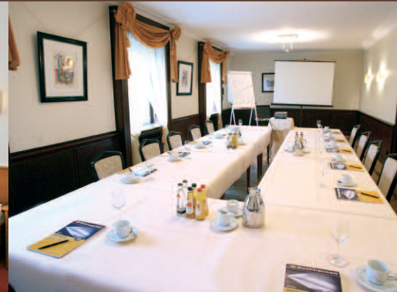
Ob Städtereise oder Geschäftstermin