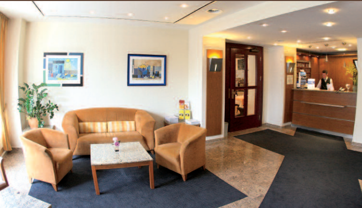
Wohnen in angenehmer Atmosphäre

Zentral wohnen in einem liebevoll geführten Privathotel