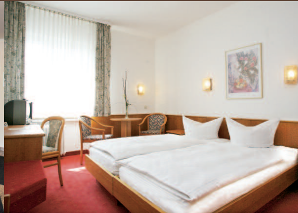
Tagen mit Charme